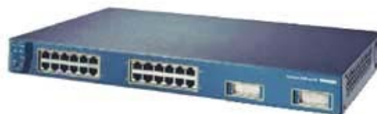
"Un conmutador (switch) de Cisco. Otros grandes fabricantes de conmutadores son HP y 3com".

Como ejemplo, se quiere grabar las imágenes de seis cámaras conectadas a un servidor situado en una habitación a 200 metros de distancia. En lugar de utilizar cables desde cada una de las cámaras utilizando 200 metros de cable por cámara – un total de 1.2 km de cable – se utilizaría un hub o un conmutador